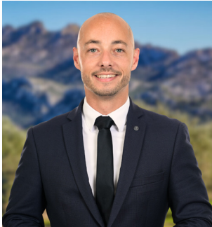
Romain BAUBRY 37 ans - Député 15ème circonscription des Bouches-du-Rhône